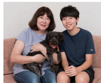
笑顔のTさんと娘さま。「3階建てでゆとりの暮らしが実現できました」とTさん