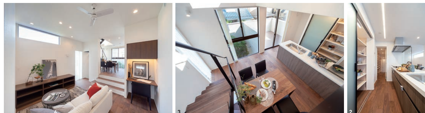
1/階段室の大きな吹き抜けから光が明るく差し込むダイニング 2/収納力たっぷりのオープンキッチン。通り抜けができるパントリーでリビングと直接つながる動線も便利 3/3階から見下ろしたダイニングキッチン。パティオの樹木の眺めも楽しめる 4/床を下げた天井高を上げ、開放感を出したリビング（見開きは全てモデルハウス）