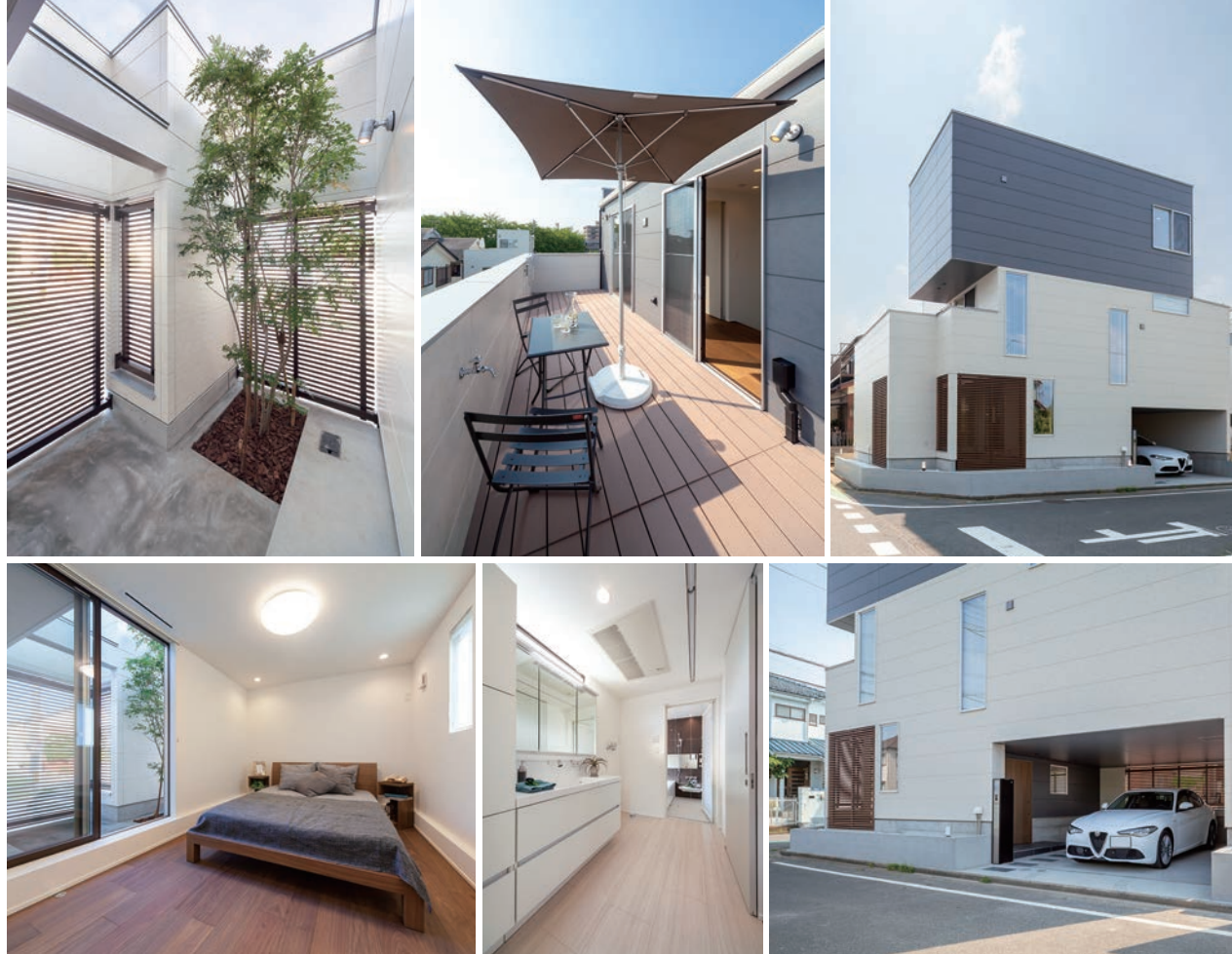
箱を積み重ねたようなスクエアなフォルムが印象的な外観。ビルトインガレージ内に玄関を設置。樹木を植えたパティオや「屋上テラス」が暮らしに潤いと楽しさをもたらす